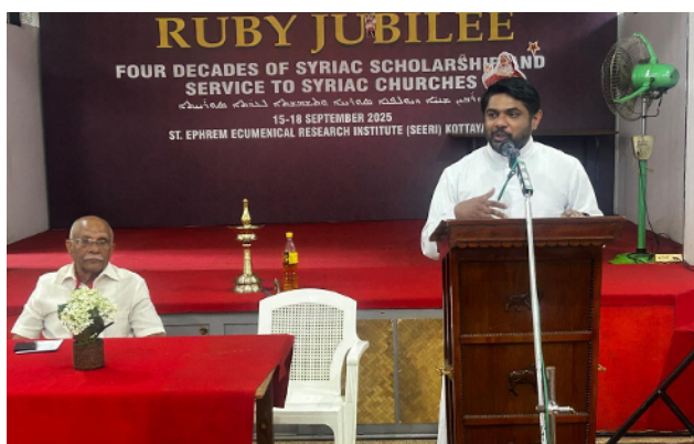
Elders' Voice Feb 2026