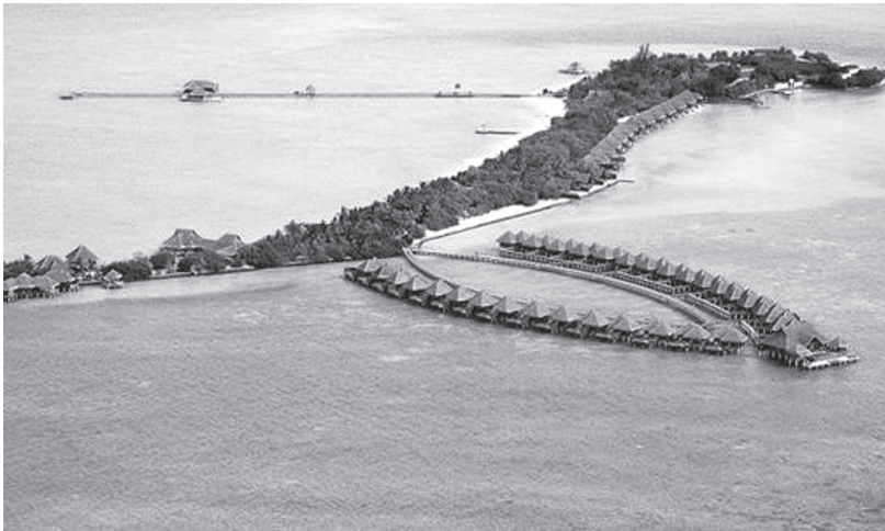
The island on which the resort is located

Covid made it hard for families that live far apart, to get together. Our family too experienced that and we were not able to see our kids and grandkids for three long years. So this summer, when the opportunity arose for us to gather, we decided to do a big family holiday together. Three generations came together and we picked Maldives to be the perfect setting.