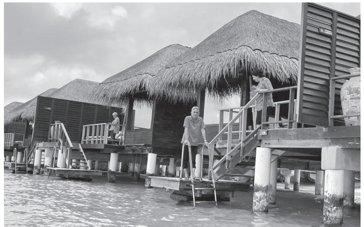
The bungalows on stilts in the ocean