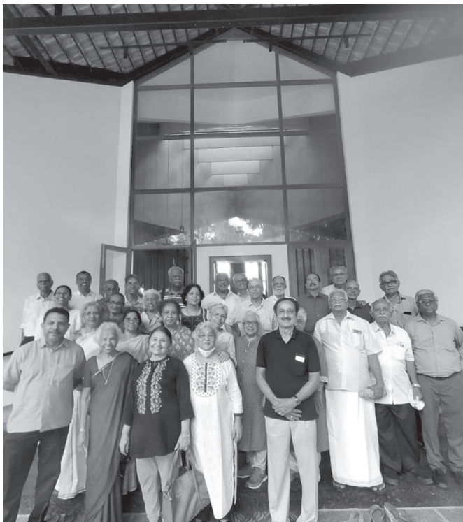
The whole group at the entrance

October has many special days. The first day of October is celebrated as the International Day of the Older Persons. The objective of having a special day is to highlight the problems faced by elder persons and to promote the development of a society for all ages. The special day was instituted through a UN resolution adopted in 1990, and designates 1 October as the International Day of Older Persons.