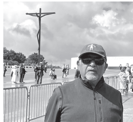
At the church of Fatima

From Córdoba we went to Seville, which is one of the largest cities of Spain. Here we had the opportunity to see the famous Spanish Flamenco dance. It was originally a gypsy dance but now it is part of Spanish culture / heritage. Seville is a beautiful city with lots of fountains and the main Seville football stadium, the Alcazar palace (where quite a