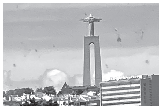
Christ the King at Lisbon

From Seville we travelled to Lisbon. There is no border control between these two countries. En route we stopped at the famous Fatima Church. As that day was Fatima's Day, there was a massive (Cont. to page no. 4)