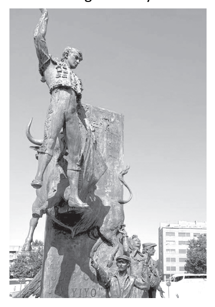
Plaza Mayor at Madrid where bull fights are held

when we were in Delhi. So we decided to go on this tour, which was organized by Cosmos