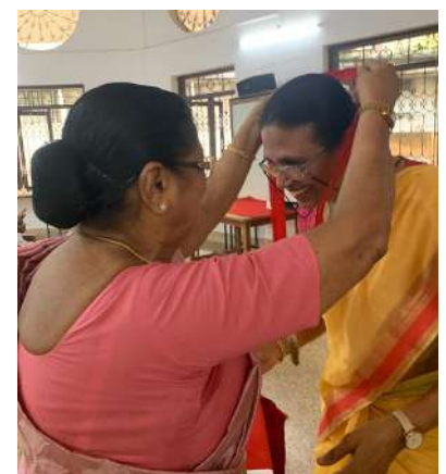
Events of the meeting on 24th April